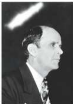
William Marrion Branham: Um Profeta Enviado por Deus

“Por meio de um profeta, o Senhor fez subir Israel do Egito, e por um profeta foi ele guardado.” Oséias 12.13