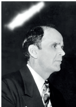
William Marrion Branham: Um Profeta Enviado por Deus

“Por meio de um profeta, o Senhor fez subir Israel do Egito, e por um profeta foi ele guardado.” Oséias 12.13