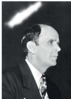
William Marrion Branham: Um Profeta Enviado por Deus

“Por meio de um profeta, o Senhor fez subir Israel do Egito, e por um profeta foi ele guardado.” Oséias 12.13