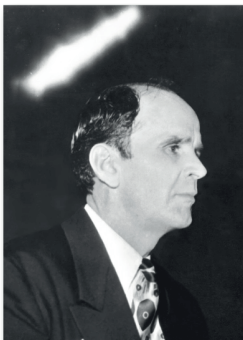
William Marrion Branham: Um Profeta Enviado por Deus

“Por meio de um profeta, o Senhor fez subir Israel do Egito, e por um profeta foi ele guardado.” Oséias 12.13