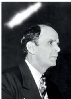
William Marrion Branham: Um Profeta Enviado por Deus

"Por meio de um profeta, o Senhor fez subir Israel do Egito, e por um profeta foi ele guardado." Oséias 12.13