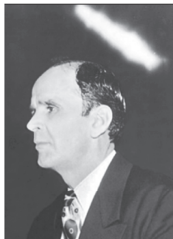
William Marrion Branham: Um Profeta Enviado por Deus

"Por meio de um profeta, o Senhor fez subir Israel do Egito, e por um profeta foi ele guardado" Oséias 12.13