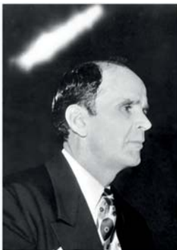
William Marrion Branham: Um Profeta Enviado por Deus

“Por meio de um profeta, o Senhor fez subir Israel do Egito, e por um profeta foi ele guardado.” Oséias 12.13