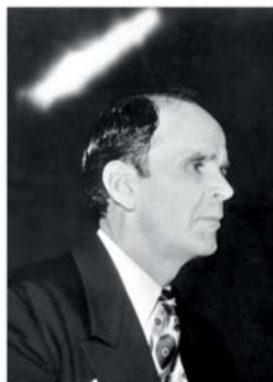
William Marrion Branham: Um Profeta Enviado por Deus

“Por meio de um profeta, o Senhor fez subir Israel do Egito, e por um profeta foi ele guardado.” Oséias 12.13