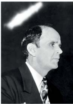
William Marrion Branham: Um Profeta Enviado por Deus

“Por meio de um profeta, o Senhor fez subir Israel do Egito, e por um profeta foi ele guardado.” Oséias 12.13