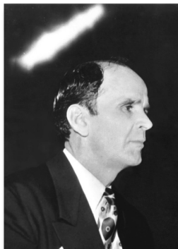
William Marrion Branham: Um Profeta Enviado por Deus

“Por meio de um profeta, o Senhor fez subir Israel do Egito, e por um profeta foi ele guardado.” Oséias 12.13