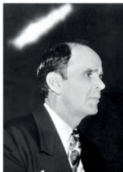
William Marrion Branham: Um Profeta Enviado por Deus

“Por meio de um profeta, o Senhor fez subir Israel do Egito, e por um profeta foi ele guardado.” Oséias 12.13