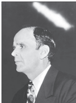
William Marrion Branham: Um Profeta Enviado por Deus

"Por meio de um profeta, o Senhor fez subir Israel do Egito, e por um profeta foi ele guardado" Oséias 12.13