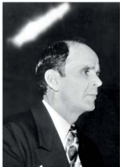
William Marrion Branham: Um Profeta Enviado por Deus

“Por meio de um profeta, o Senhor fez subir Israel do Egito, e por um profeta foi ele guardado.” Oséias 12.13