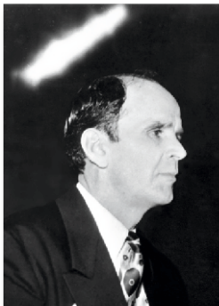
William Marrion Branham: Um Profeta Enviado por Deus

“Por meio de um profeta, o Senhor fez subir Israel do Egito, e por um profeta foi ele guardado.” Oséias 12.13